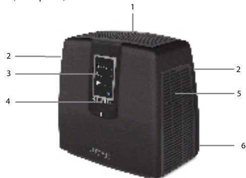
Fig. 1 (front panel)