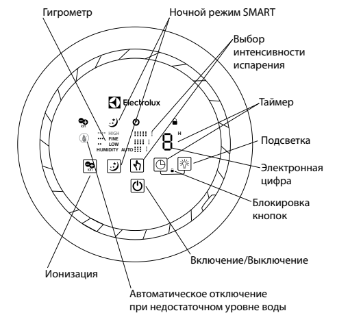
Рис. 3. Дисплей и панель управления