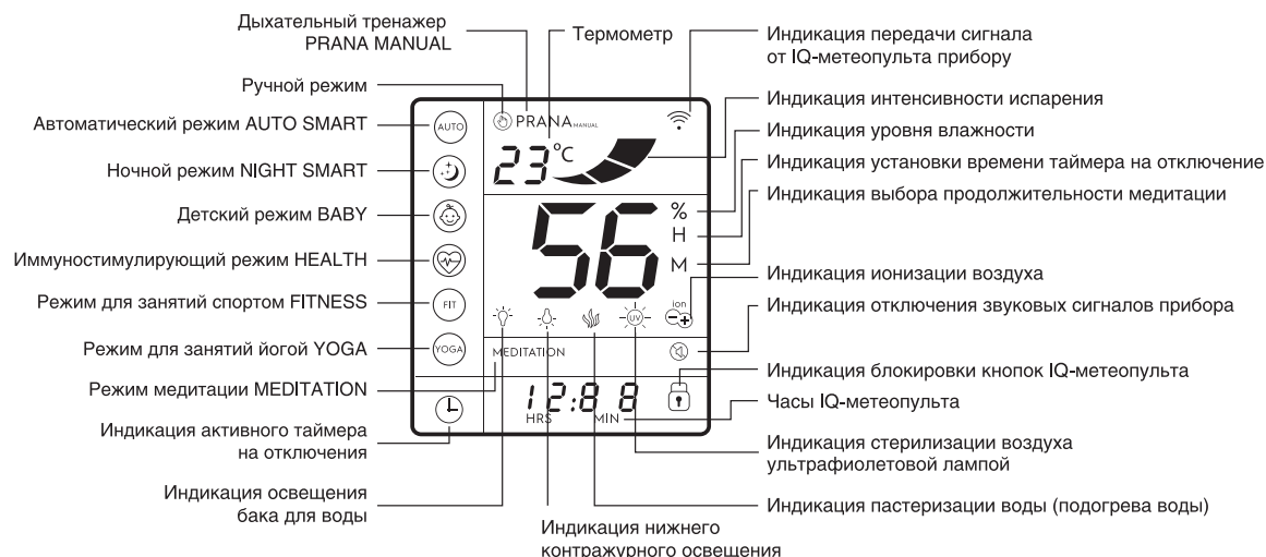
Рис.3 Дисплей IQ-метеопульта