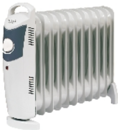
TOR 11... SD