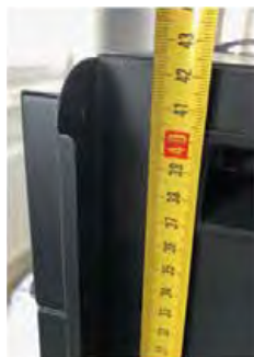
Высота – 42,5 см