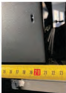
Глубина – 21,5 см (включая отверстие для кабеля).